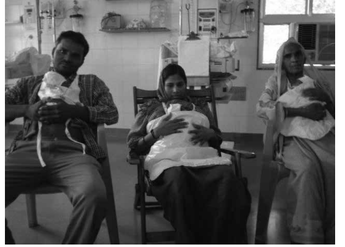
અને બાજુનાં ચિત્રો)

બાળકોને બચાવવાની મથામણ કરી રહ્યા હતા. આધુનિક ઉપકરણો, બાળકોને ગરમાવો આપવા માટેની સુવિધાઓ, વિશેષ સંભાળના કક્ષ... એક તરફથી આ બધું મોઢુંદાટ તો હતું જ; પણ સાથેસાથે ધાર્યા પરિણામ પણ ન'તાં મળતાં. સુવિધાઓની ક્ષમતા કરતાં અનેકગણા વધુ નવજાત શિશુઓને સમાવવાની જરૂર, હોસ્પિટલમાંથી બાળકોને લાગી જતાં અન્ય ચેપ, માતા અને શિશુને વિખુટાં અને અલગ રાખવાની પદ્ધતિ, સ્તનપાનમાં પડતા વિક્ષેપો... આમ અનેક પ્રકારના અવરોધો આવાં નબળાં અને નાજુક નવજાત શિશુને માંદગી અને મરણ તરફ ધકેલતા હતા. આ સંજોગોમાં ડૉ. એડગર રે અને ડૉ. સેમ્યુઅલ માર્ટિનેઝને કાંગાડૂ પ્રાણીમાં જોવા મળતી આ કુદરતી “ઈન્ક્યુબેટર” પદ્ધતિમાંથી પ્રેરણા મળી. પરિણામે ૧૯૭૮-૭૯માં તે બંનેએ “કાંગાડૂ માતા સંભાળ” અપનાવી.